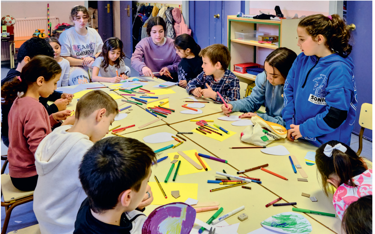
Voluntarios acompañando a menores en uno de los talleres del proyecto Educ-Arte

Participan en él un total de 17 voluntarios universitarios, estudiantes del grado de Educación Infantil y Primaria en la Facultad Fray Luis de León, y voluntarios estudiantes de 2º de Bachillerato.