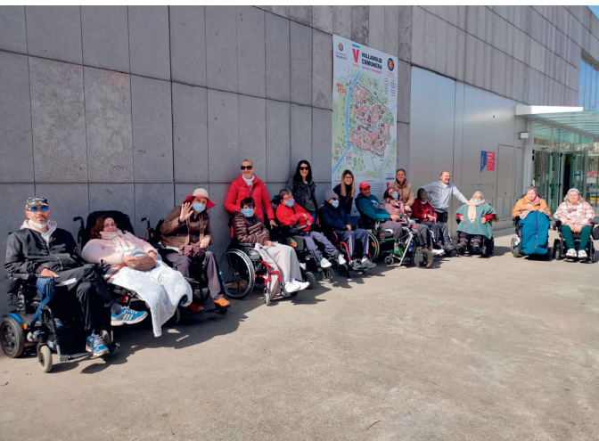
Voluntarios e internos en el transcurso de uno de los paseos

Durante todo el año, un grupo de voluntarios ha ofrecido acompañamiento dos días a la semana a internos del Centro Julio Herrero, que la entidad ASPAYM gestiona en el Barrio de Covaresa, en Valladolid.