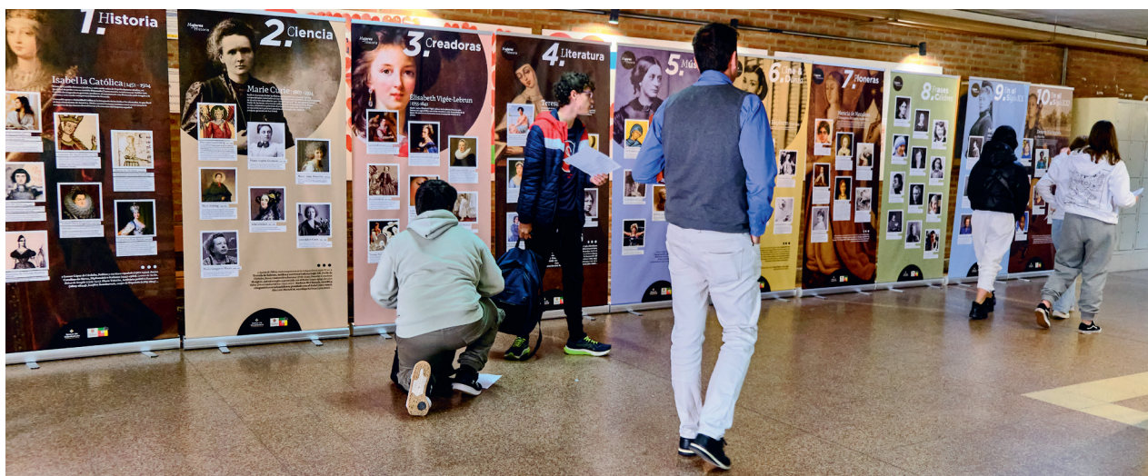
Exposición Mujeres en la Historia en el IES Núñez de Arce, Valladolid

Está en proceso de firma el Convenio de colaboración con Asociación para el desarrollo de los cuidados paliativos y tratamiento del dolor de Castilla y León (ACPD).