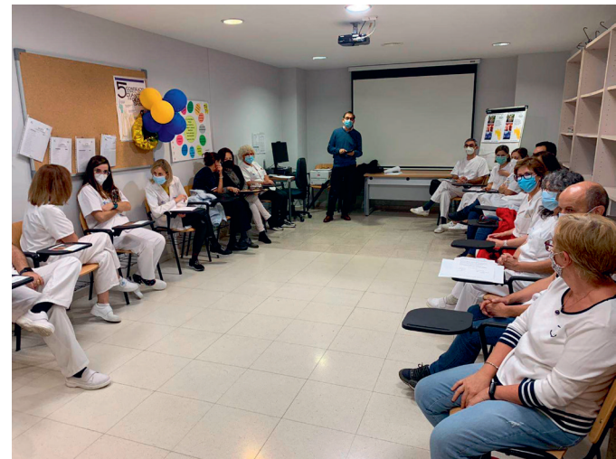
Reunión previa con el personal de la residencia

Se han realizado tareas de acompañamiento a residentes de la Residencia Pública Asistida de la 3 a Edad La Rubia, Carretera de Rueda 64, Valladolid y en la Residencia de la 3 a edad de la Asociación Vallisoletana de Ayuda a la Ancianidad y la Infancia (ASVAI).