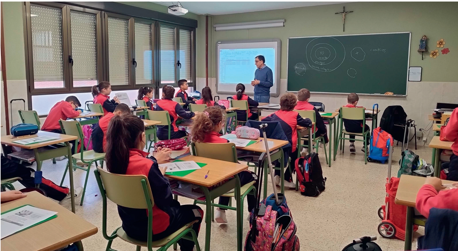
Sesión impartida con un grupo de alumnos