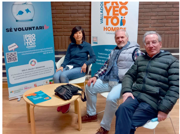
Voluntarios en la recepción de la sede

Un grupo de voluntarios del Banco, han cubierto turnos diarios en la recepción de la sede que Proyecto Hombre tiene en Valladolid.