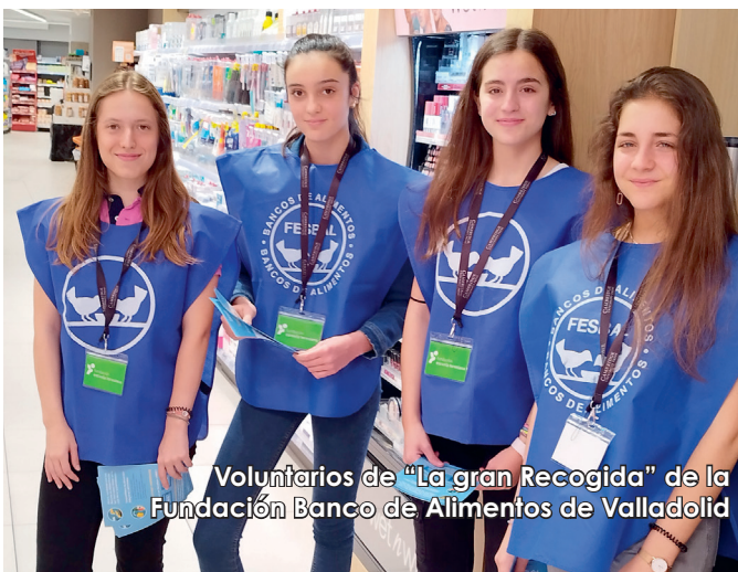
Voluntarios de “La gran Recogida” de la Fundación Banco de Alimentos de Valladolid

Hemos colaborado en la Gran Recogida de alimentos que el Banco de Alimentos de Va-